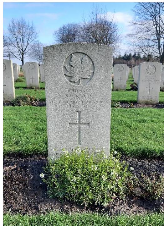
Groesbeek – 19 februari 2020

Op 27 juli 1945 wordt hij herbegraven op de Canadese Oorlogsbegraafplaats in Groesbeek, graf V. A. 7.